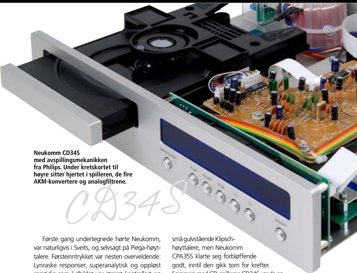
Neukomm CD345 med avspillingsmekanikken fra Philips. Under kretskortet til høyre sitter hjertet i spilleren, de fire AKM-konvertere og analogfiltrene.